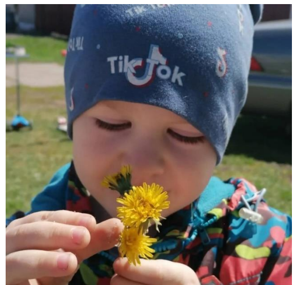
Рассматривают каждый цветок.