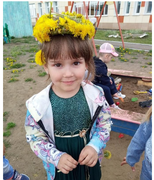
Плетут венки и дарят их друг другу.